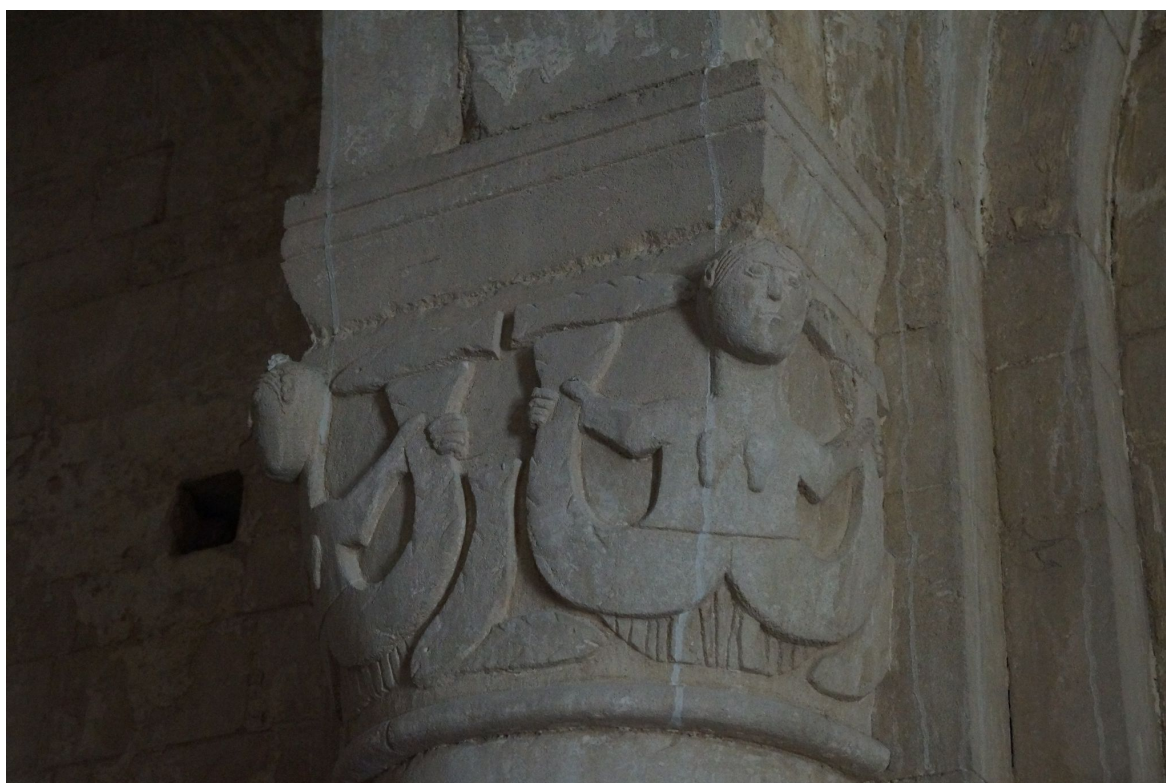
(Capitello interno chiesa di San Pietro al Conero, Sirolo, Marche)

Collegata alla morte in quanto passaggio, sempre in bilico tra sessualità-materialità e spiritualità-conoscenza, la sirena risulta dunque la personificazione mitologica del soprannaturale da poter comprendere, riuscendovi però solo se si è in grado di tenere l'equilibrio. In ciò, la sua iconografia riporta direttamente all' ancora . L'uomo ha natura divina-spirituale ma rimane ancorato alla propria inscindibile controparte terrena-materiale che, quando predomina, lo conduce alla morte nella distruzione di se stesso.