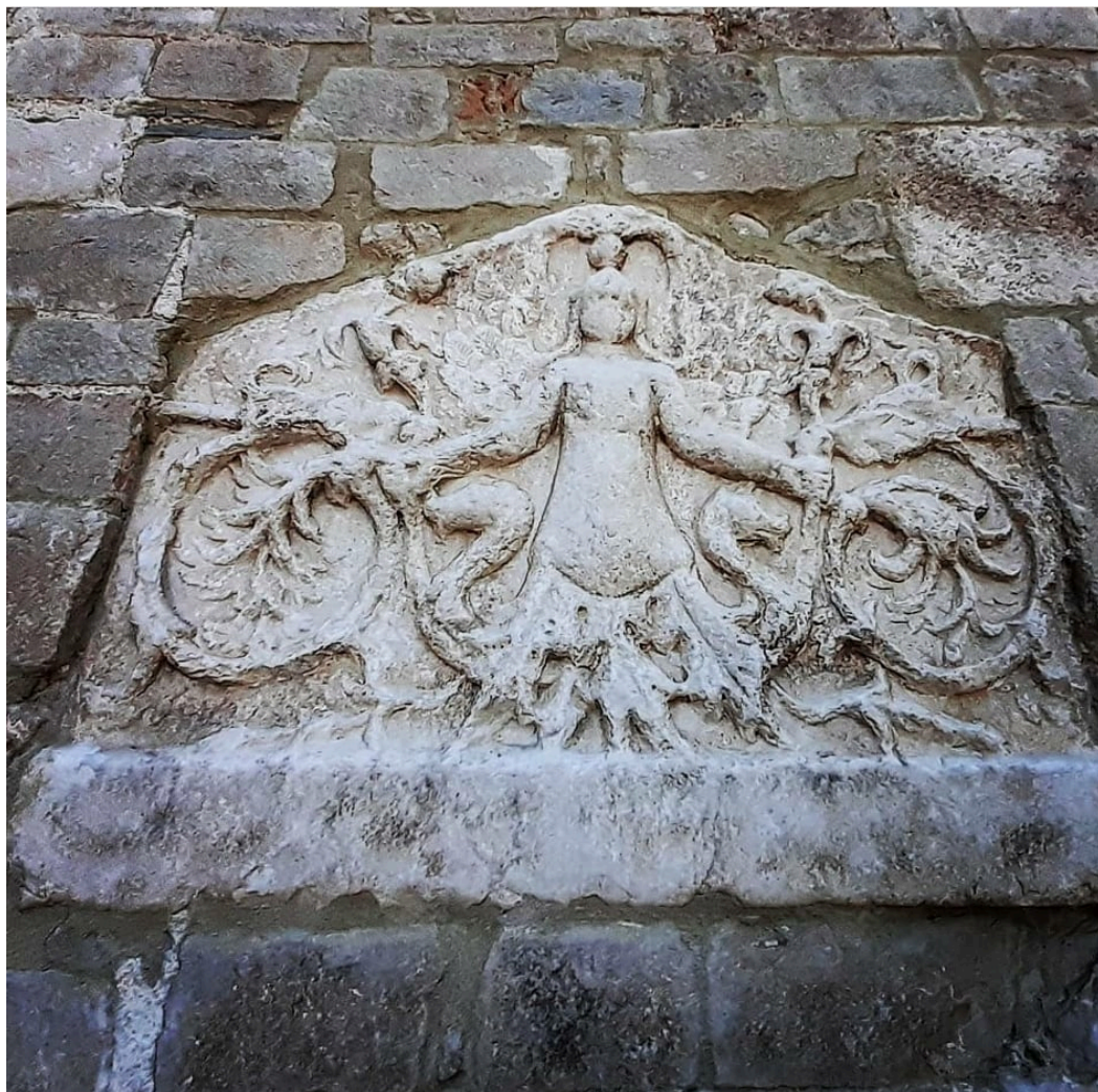
(Facciata della chiesa di San Michele Arcangelo, Bojano, Molise)

Ma la costruzione grafica di tale immagine rimanda al Legame tra Dio e l'uomo (i 2 cerchi dallo stesso raggio) che passa attraverso l'intermediazione del Cristo-Iczùs. Che è poi il nucleo unitario preesistente alla separazione degli opposti. Questi opposti trovano la propria riunificazione nel concetto-immagine della mandorla mistica. Cioè l'Iczùs in verticale, che è qui simbolo di fertilità e immortalità. Quindi è simbolo della Via, della Verità e della Vita che nella sua duplice natura (divina e umana) riunita rappresenta il superamento di ogni dualismo. Cristianesimo a parte, resta il fatto che il pesce significa da sempre "conoscenza", in quanto è l'antonomasia simbolica della saggezza, in grado di dominare le correnti emotive, così che tutti i portatori di conoscenza,