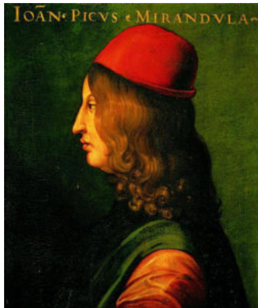
(Pico della Mirandola)

Orfeo sono nomi non di demoni ingannatori, dai quali venga male e non bene, bensì virtù o energie divine, distribuite nel mondo dal Dio vero, ad utilità speciale dell'uomo che sappia farne uso". Questo retaggio esoterico, che ha origine nella scolastica medievale come in Alberto Magno, nel riformismo religioso ermetico platonizzante dei rinascimentali di Ficino e Pico, sarà trasmesso anche a nord delle Alpi fino all'area germana, in particolare dall'umanista Johannes Reuchlin, anello di congiunzione tra l'Accademia Fiorentina e la Sodalitas Litteraria Rhenana. Nel "De Arte Cabbalistica" Johannes Reuchlin definisce la Cabala come "una Teologia simbolica nella quale non solo le lettere e i nomi sono segni delle cose, ma anche le cose stesse ne simboleggiano altre"; influenzato dalla concezione pichiana sulla Cabala come coronamento della magia, dalla tradizione ebraica, sosterrà la possibilità di confermare la fede cristiana attraverso la Cabala; così come abbiamo già visto precedentemente trattando di altri filosofi umanisti, è ricorrente un rinvenimento di temi cristiani nelle tradizioni, qui però rafforzato dal calcolo cabalistico e dalla dottrina pitagorica.