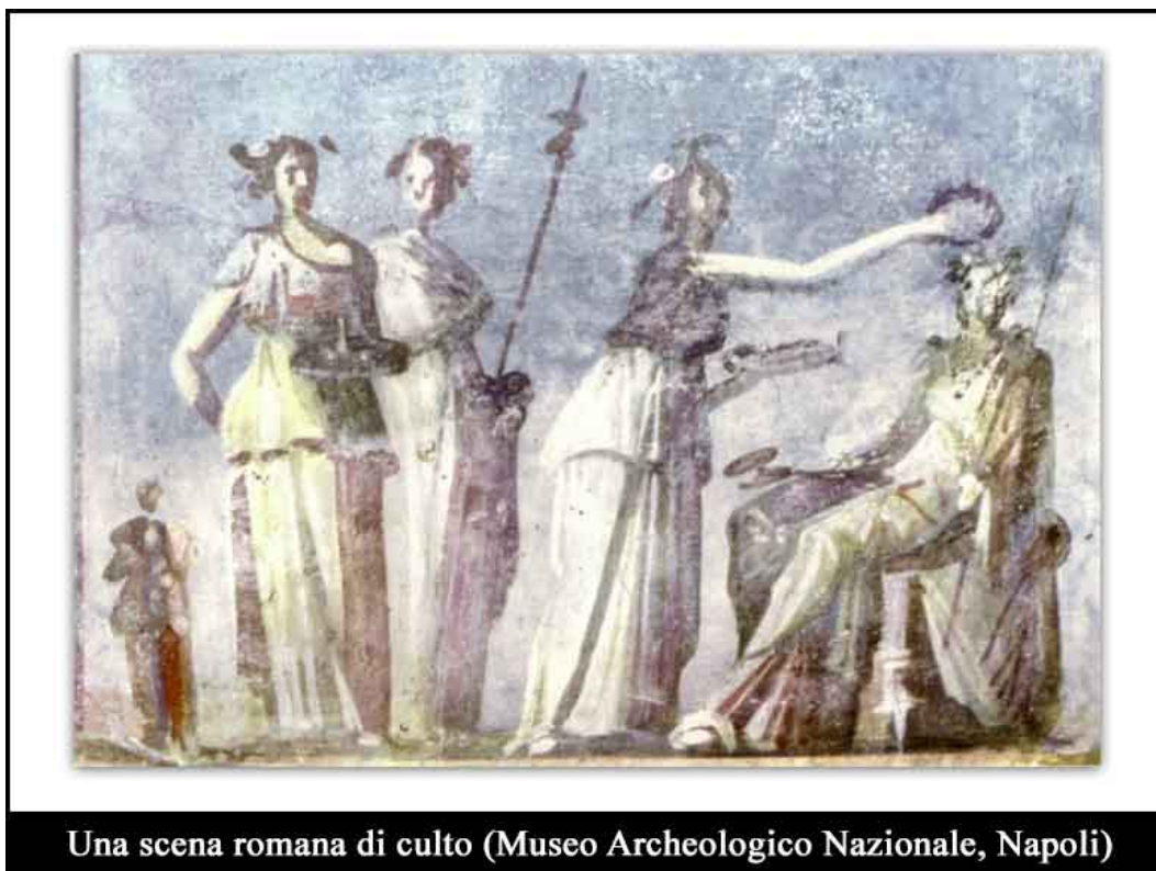
Una scena romana di culto (Museo Archeologico Nazionale, Napoli)

In esso è evidente in modo solare che il “caos”, di cui parlavamo, e cioè la natura come nulla acosmico che il Romano con il rito giuridico-religioso muta nel Cosmos secondo il Fas dello Ius , non è altro che il Diritto naturale identificato con il costume degli animali = more ferarum . Ulpiano dice, ed a chiare lettere, che lo Ius naturale è quello che la natura biologico-fisicistica indica, impone a tutti gli animali e non certamente all’uomo, se non nella sua dimensione strettamente e propriamente naturalistica in senso biologico, come ritmi di vita che, comunque, vengono governati ed ordinati in via subordinatamente gerarchica da una precisa sfera culturale che si riconduce sempre e soltanto al mondo dello Spirito che è quello dello Ius civile ed è essenzialmente di natura religiosa. È talmente chiarificatrice tale esposizione di Ulpiano che è, non si dimentichi, un giurista del III secolo d.C. (e che, si presume, abbia potuto recepire l’intera letteratura sia strettamente filosofica al riguardo quanto il pensiero medesimo dei giuristi che lo hanno preceduto) da non essere gradita ad un giusfilosofo quale Guido Fassò, di formazione culturale cattolica, il quale rimprovera[22] addirittura ad Ulpiano una concezione troppo “naturalistica”