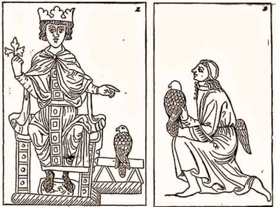
FREDERICK II. AND HIS FALCONER AND HAWKS.

Tuttavia, sebbene il De Arte Venandi sia oggi il trattato maggiormente conosciuto, esistono manoscritti ancora più arcaici dai quali, molto probabilmente, fu ispirato lo stesso Federico II. Primo tra tutti, il De Avibus tractatus , in cui il filosofo Adelardo di Bath, affronta temi riguardanti lo studio delle malattie dei rapaci. Ma il trattato che per secoli godette di maggior diffusione e autorevolezza tra i signori d'Europa fu il Dancus Rex . Redatto presso la corte Normanna di Sicilia, mette in evidenza il ruolo regale e filosofico della falconeria. La falconeria viene infatti descritta da un certo Re Gallaciano, come l'arte sapienziale di far catturare da un rapace addestrato un mammifero o un uccello. Il De Avibus Tractatus narra della storia di un Re dal nome Gallaciano, che decide di rinunciare al suo Regno per diventare suddito di un certo Re Danco, da cui avrebbe appreso l'arte della Falconeria. La rinuncia volontaria al potere e alla regalità costituisce un atto simbolico da cui è possibile scorgere l'importanza che assumeva l'addestramento dei rapaci per gli uomini del tempo. Sebbene la falconeria sopravviva ancora oggi, assumendo forme e modalità diverse come la riabilitazione, l'allevamento dei rapaci per la reintroduzione