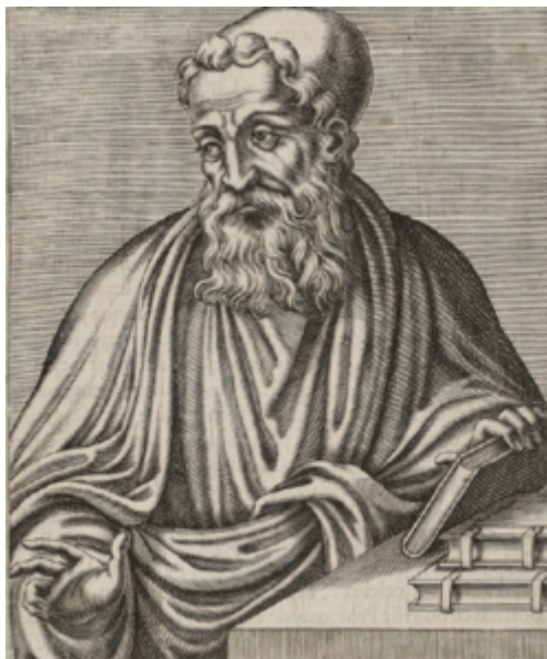
(Sinesio di Cirene)

Da parte sua, Sinesio di Cirene si concentrò sul legame tra i sogni e l'immaginazione come qualità propria di ogni essere umano; riteneva che «quando sogniamo, in ognuno di noi c'è un oracolo» che si esprime tramite le immagini e le scene oniriche. Sinesio, che era stato un allievo del circolo neoplatonico della celebre scienziata Ipazia di Alessandria, conservò in parte questo retroterra, basandosi su un'idea abbastanza diffusa nell'età tardo-antica: l'immaginazione umana concepita come parte di una immaginazione assoluta, diffusa nel cosmo, definita phantàsia , una sorta di immenso bacino metafisico di possibilità creative, che produce anche le immagini allegoriche mostrate, da Dio o dagli dèi, in sogno agli esseri umani. Riassume l'Autrice: «Per Sinesio, la phantàsia non è una cosa trapiantata negli esseri umani, come fosse un loro possesso. Essa è piuttosto un regno, "il cavo abisso dell'universo", nel quale l'anima ha la sua sede appropriata. [...] In quanto attività propria dell'anima, la phantàsia è, secondo Sinesio, "una sorta di vita a sé stante" e, come si legge in una sua ulteriore spiegazione, l'attività immaginativa che ha luogo nei sogni è la più preziosa, poiché, mentre le conoscenze diurne vengono dai docenti, le conoscenze avvenute in sogno derivano da Dio». L'apprendimento onirico, quindi, «apre una via all'ascesa al lato più occulto delle