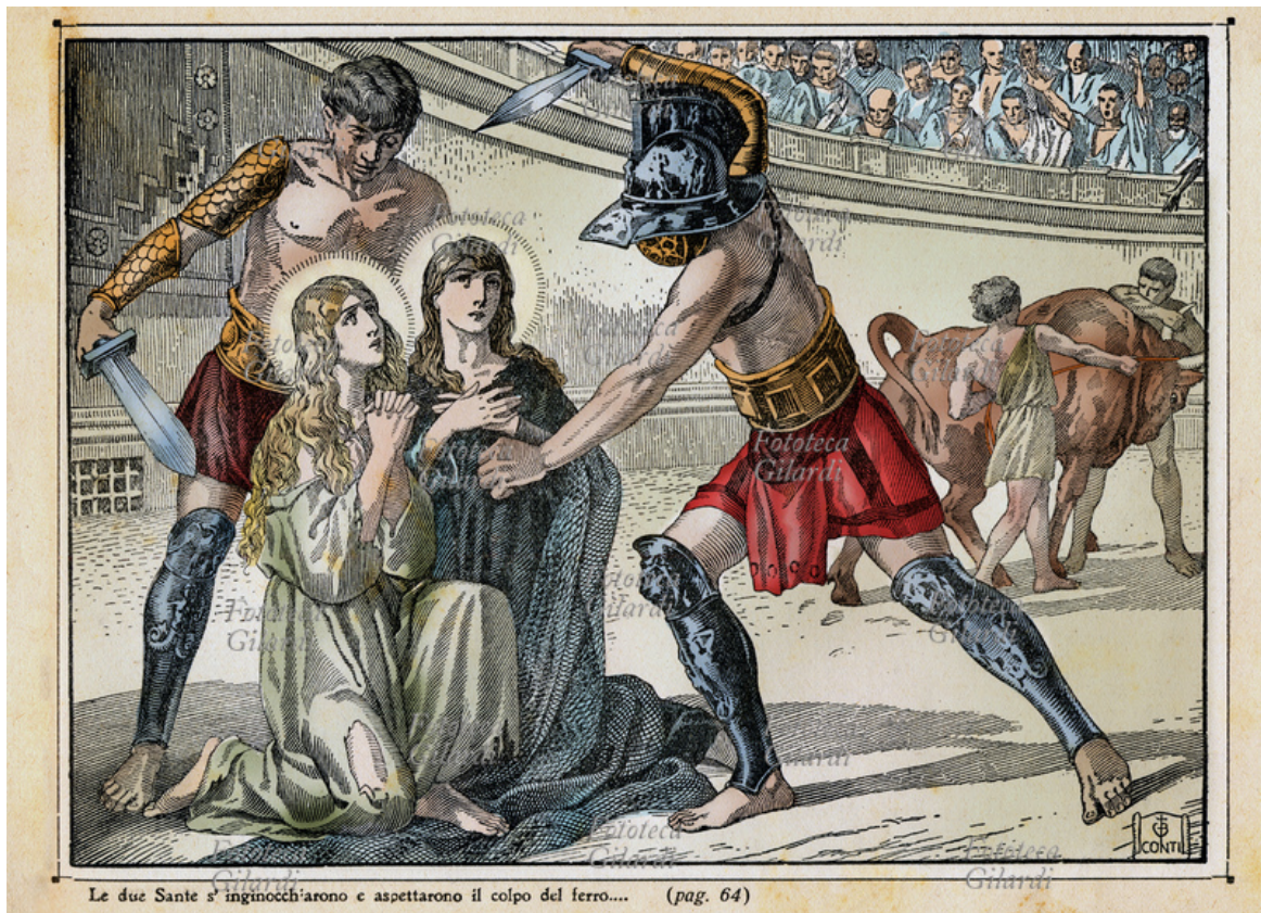
Le due Sante s'inginocchiarono e aspettarono il colpo del ferro... (pag. 64)