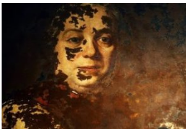
(Ritratto di Raimondo De Sangro di Carlo Amalfi, 1759)

Gli insegnamenti ermetico-alchemici tritemiani confluirono nei circoli rosacrociati tedeschi e olandesi, ed influenzarono più o meno direttamente le prime manifestazioni della Massoneria Egizia, basti qui ricordare, come rappresentante di questa corrente, che si rifaceva ai cosiddetti Misteri egizi-alessandrini, il Gran Maestro della Massoneria Napoletana, il principe di Sangro, Raimondo di S. Severo (1710-1771). La corrente egiziana-alessandrina, che vide Napoli come centro occulto, per le sue attività ermetiche e alchemiche, confluirà nel Rito di Misraim e soprattutto nell'Ordine Osirideo Egizio, e da questo la Fratellanza Terapeutica di Miriam (2).