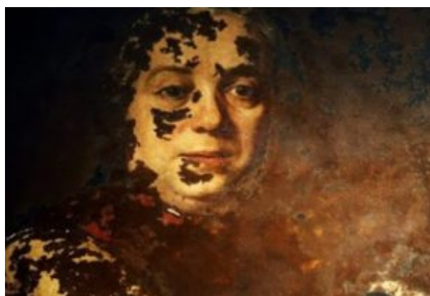
(Ritratto di Raimondo De Sangro di Carlo Amalfi, 1759)

Gli insegnamenti ermetico-alchemici tritemiani confluirono nei circoli rosacrociati tedeschi e olandesi, ed influenzarono più o meno direttamente le prime manifestazioni della Massoneria Egizia, basti qui ricordare, come rappresentante di questa corrente, che si rifaceva ai cosiddetti Misteri egizi-alessandrini, il Gran Maestro della Massoneria Napoletana, il principe di Sangro, Raimondo di S. Severo (1710-1771). La corrente egiziana-alessandrina, che vide Napoli come centro occulto, per le sue attività ermetiche e alchemiche, confluirà nel Rito di Misraim e soprattutto nell'Ordine Osirideo Egizio, e da questo la Fratellanza Terapeutica di Miriam (2).